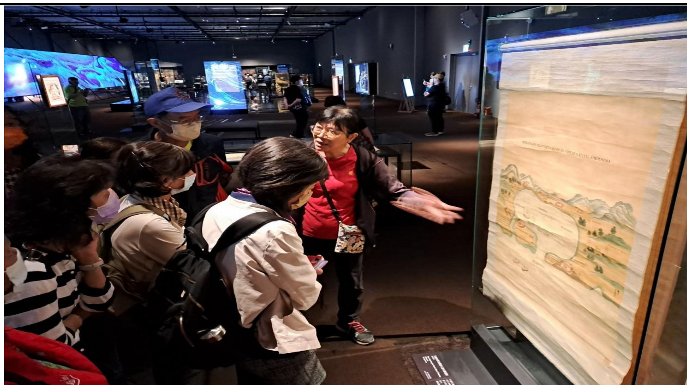
相片說明：推動樂齡課程前往史博館