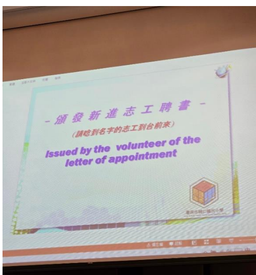
說明：介紹新進團員