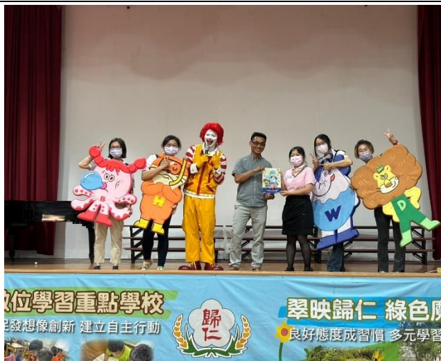
說明：活動結束全體合照