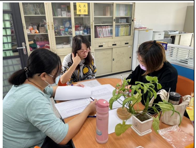
說明: 志工團旅行活動行前會議