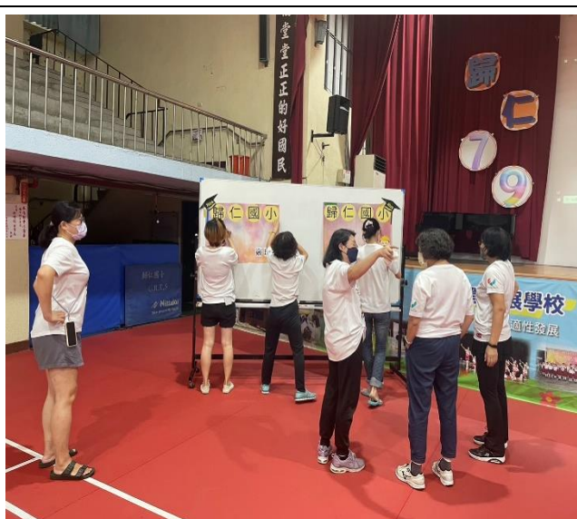
說明: 活動前討論準備會議(二)