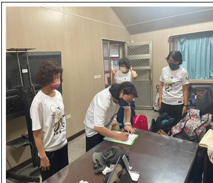
說明：活動前討論準備會議(一)