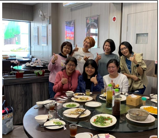
說明: 113下團務討論會議