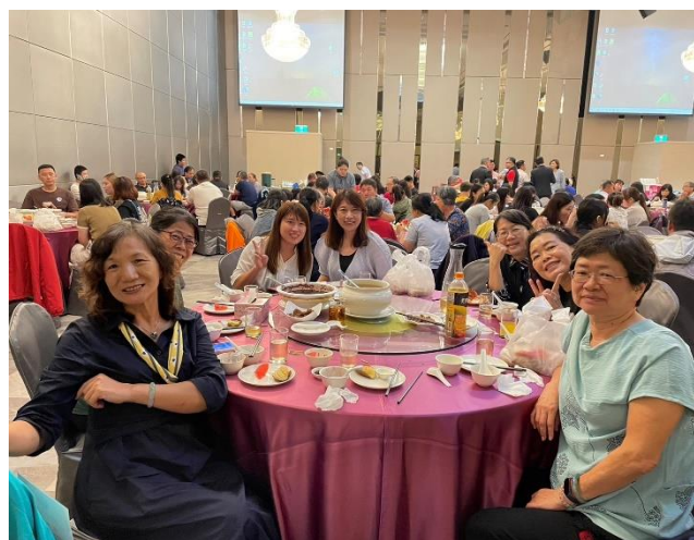
說明：愛心志工團團員合照