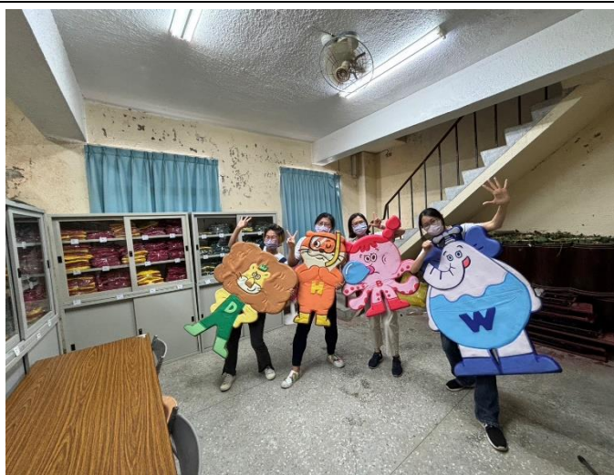
說明：志工團結結合社區資源辦理學生「洗手」活動討論會議(三)