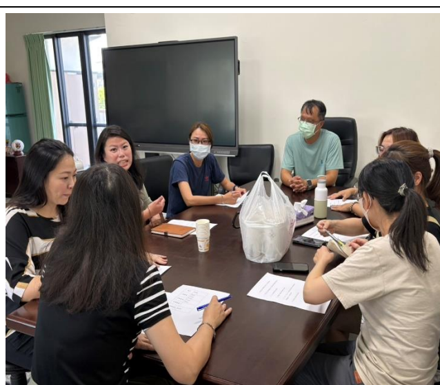
說明:新任團長及幹部討論準備會議(二)