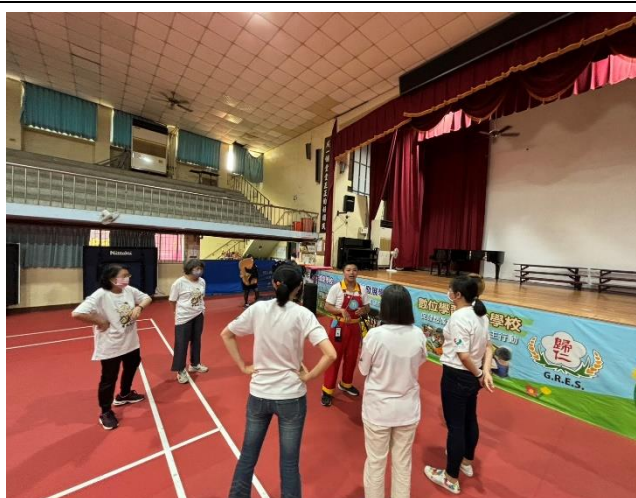
說明：志工團結結合社區資源辦理學生「洗手」活動討論會議(二)