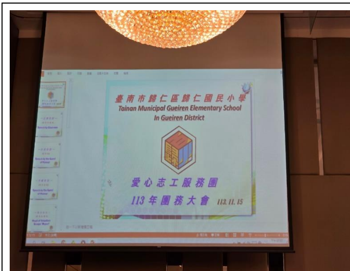
說明：愛心團務大會