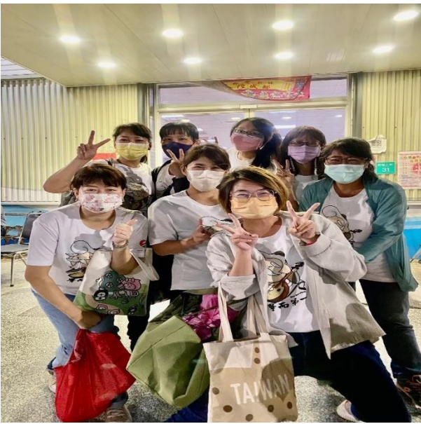
說明：113上團務討論會議