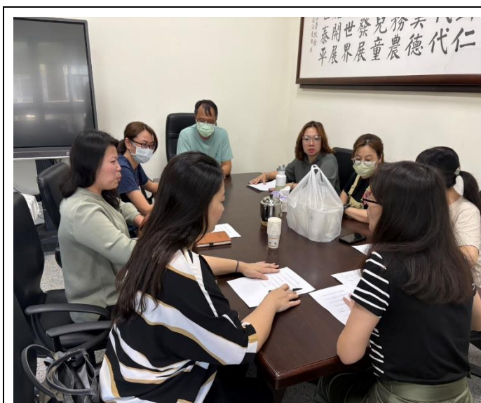
說明：新任團長及幹部討論準備會議(一)