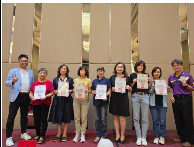
說明：頒發資深優良志工降狀