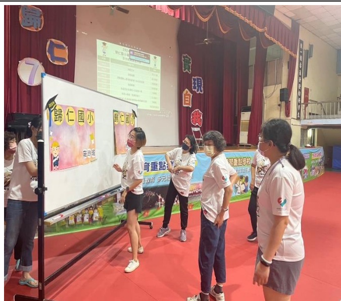
說明：活動前討論準備會議(三)