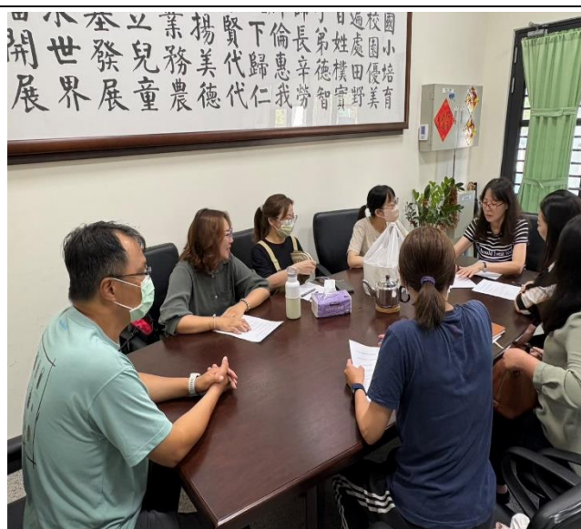
說明:新任團長及幹部討論準備會議(四)