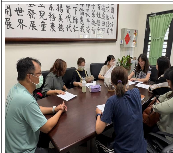
說明：新任團長及幹部討論準備會議(三)