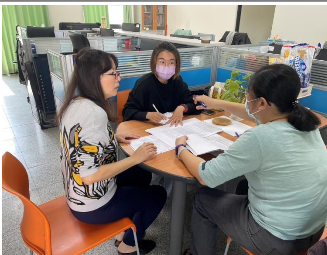
說明: 志工團旅行活動行前會議