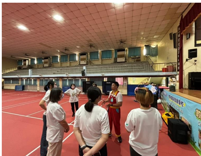
說明：志工團結結合社區資源辦理學生「洗手」活動討論會議(一)