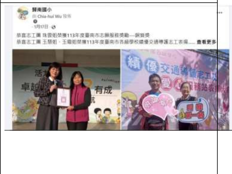
相片說明：上圖是臉書報導(校網設定臉書發文同步更新)，謝謝志工媽媽們積極協助學校活動，守護孩子與校園。