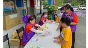
志工媽媽們協助安得烈食物銀行捐贈活動