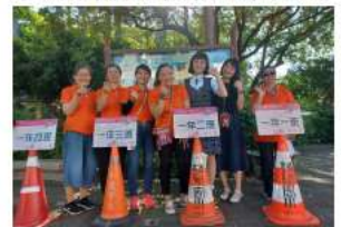
志工媽媽們在開學時協助引導一年級新生順利進入教室