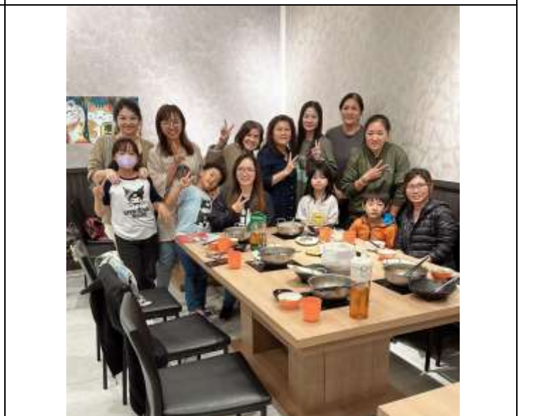
相片說明：志工團幹部會議與餐敘，宣導與溝通協助推動校務。