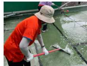
志工媽媽們協助校園登革熱巡檢