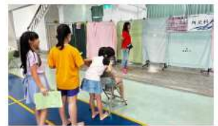
志工媽媽們協助學童健康檢查並安撫打針哭哭的孩子

感謝志工夥伴們無私的奉獻，讓校園充滿陪伴與溫暖，邀請對志工服務有興趣的您一起來擔任孩子們的守護天使。意者請掃描 QRcode 留下您的資料和可以服務的時間，誠摯歡迎您加入志工團行列，共同關心孩子的成長！