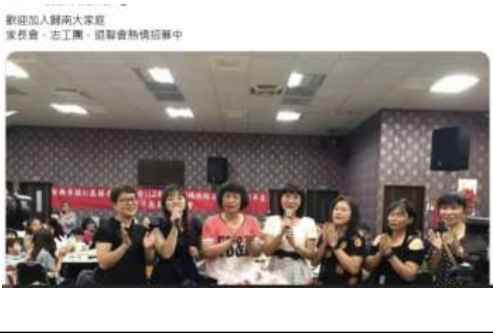
歡迎加入歸南大家庭 家長會、志工團、道聲會熱情招募中