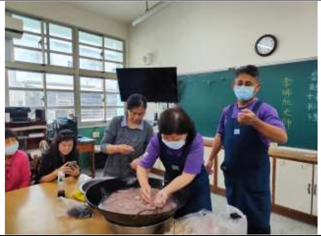
相片說明：鼓勵志工參加樂齡研習，學習新知與社會互動。