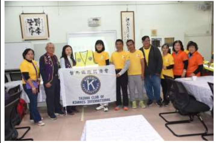
相片說明：志工團獲得國際同濟會捐贈導護執勤背心，提高交通導護執勤的安全度。