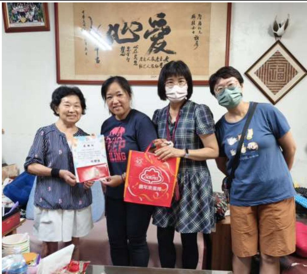
相片說明：輔導室主任、組長及團長前往志工家探望志工，並代表學校致贈感謝狀與禮券。