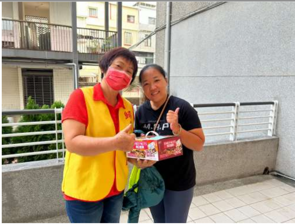
相片說明：團長代表學校志工隊慰問受傷志工夥伴，表達關懷與敬意。