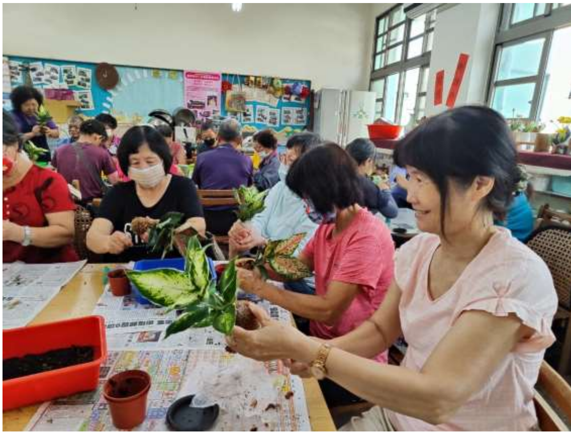
相片說明：志工增能研習—樂齡園藝動手做。