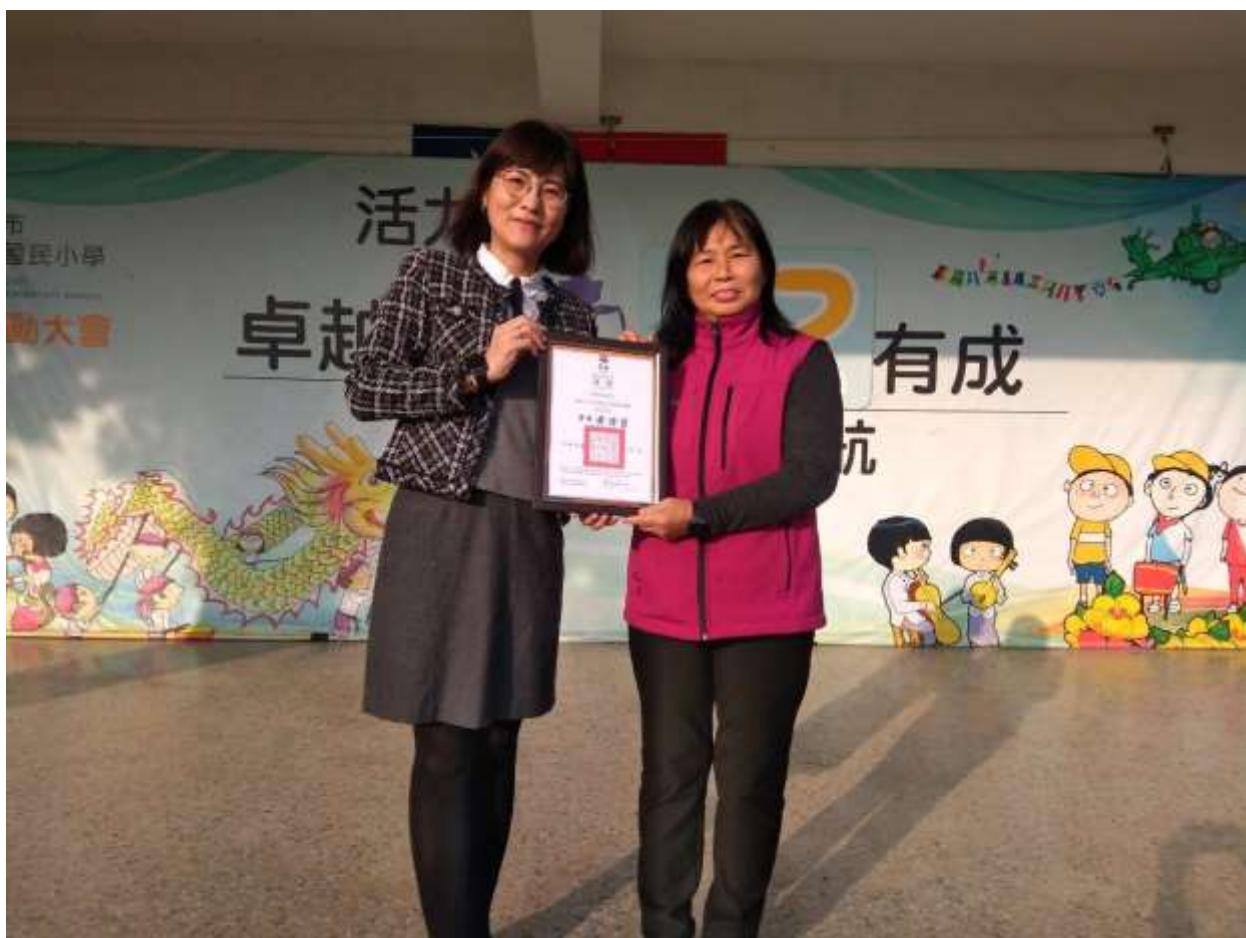
相片說明：利用學生朝會，公開場合表揚績優志工。