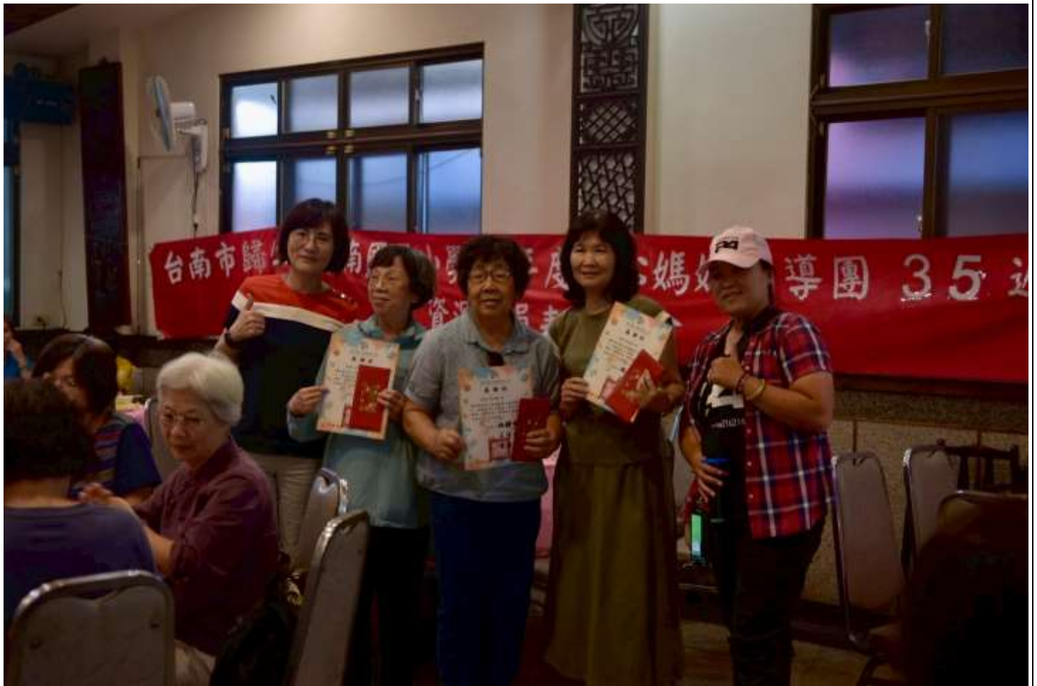
相片說明：每年辦理志工團慶活動，公開表揚長期投入服務的資深志工，提升榮譽感。