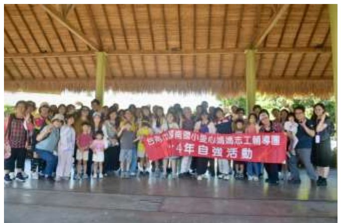
相片說明：兩年一次的志工團自強活動，鼓勵志工夥伴和家屬一起參加，聯絡感情。