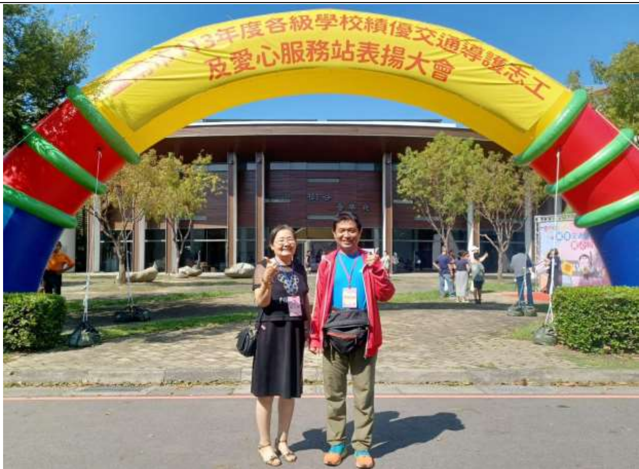
相片說明：利用表揚大會，公開表揚績優志工。