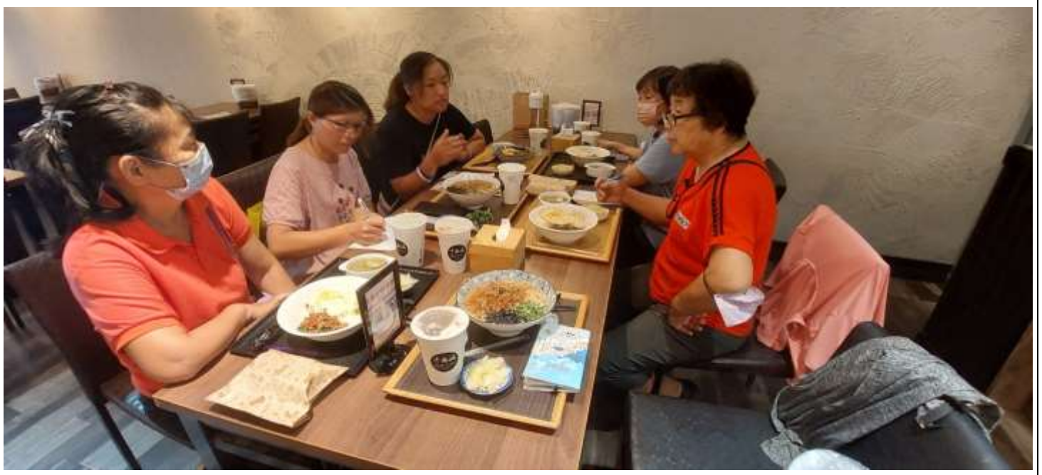
相片說明：團內定期召開幹部會議，討論團務運作。