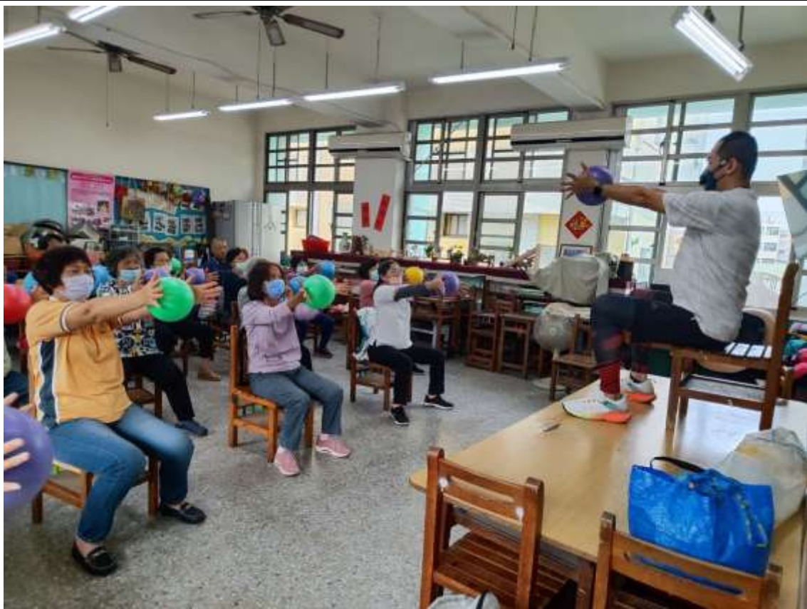
相片說明：志工增能研習-銀向健康齡煩惱。