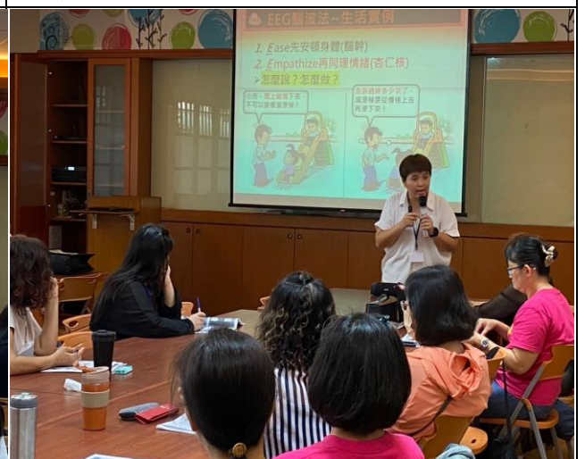
情緒處理，從自我覺察開始，積極聆聽，助孩子自我覺察。