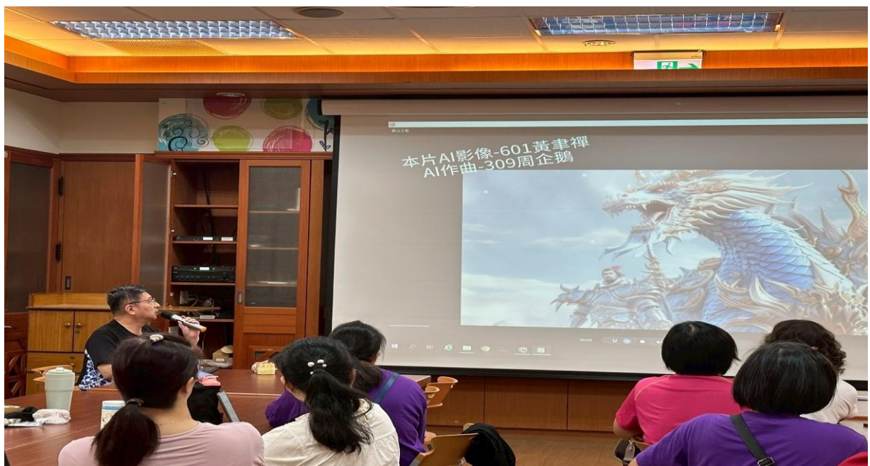
113 學年度志工團資訊能力提升研習，-AI 與生活。

活動說明：本校志工團伙伴，犧牲奉獻，全力支援學校所有活動盡心盡力。學校特申請辦理志工人工智慧專業知能研習，以提高志工家長資訊能力，更能將人工智慧運用在志願服務上，如圖書借閱線上服務及伴讀、共讀線上資源運用…等，頗符合資訊化人工智慧社會潮流。