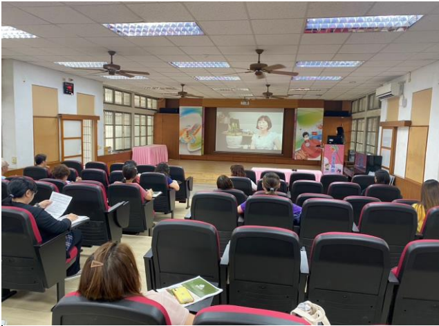
「臺南市家庭教育中心形象片」播放