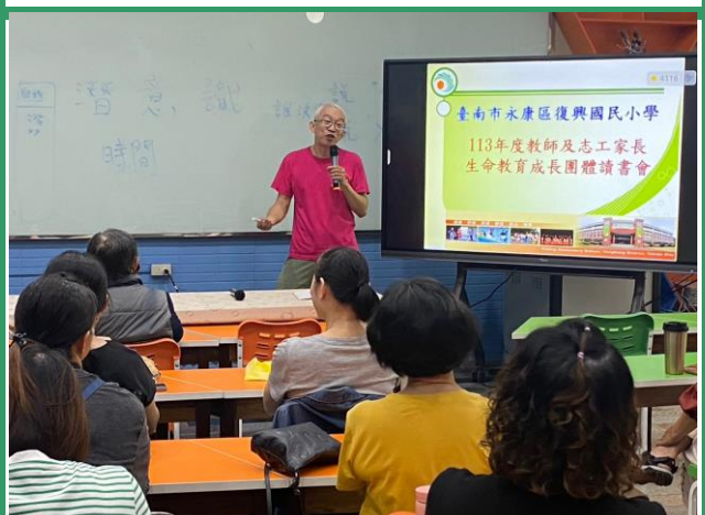
照片說明：講師與學員分享討論。