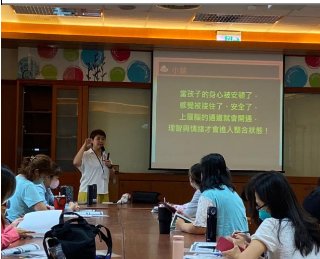
當孩子的身心被安頓了，理智與情緒才會進入整合狀態！