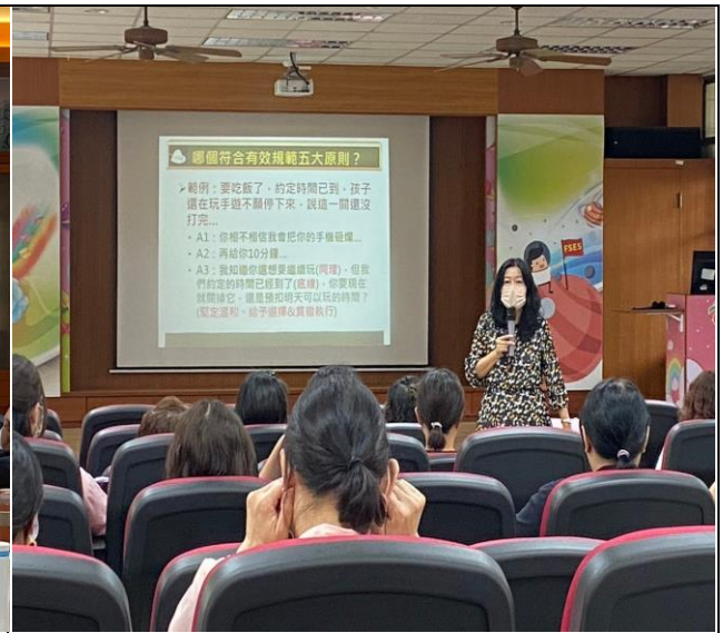
設定明確的規範，並堅定溫和的徹底執行，孩子也比較能夠接受。