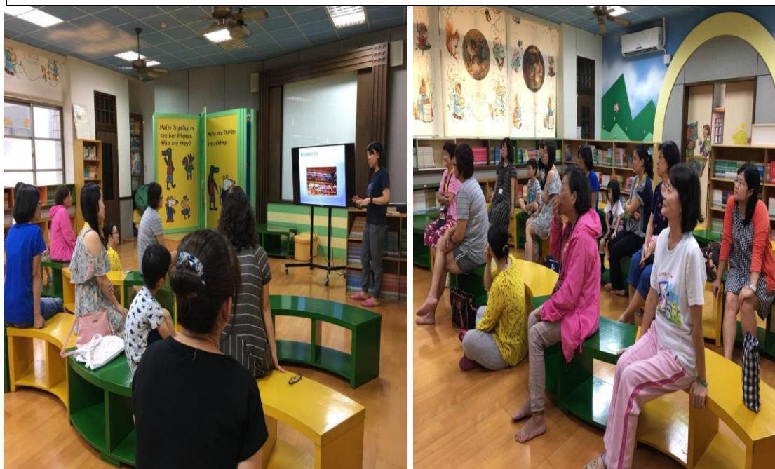
校內圖書館館長說明圖書歸類注意事項