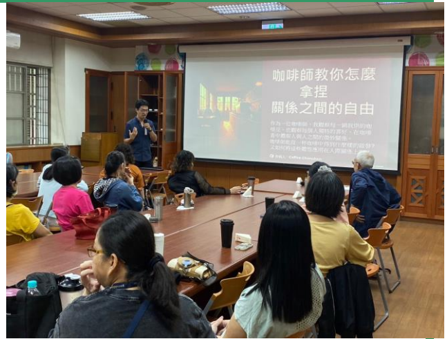
照片說明：講師說明生命教育主題。