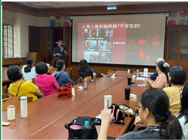
照片說明：透過影片分享生命教育。