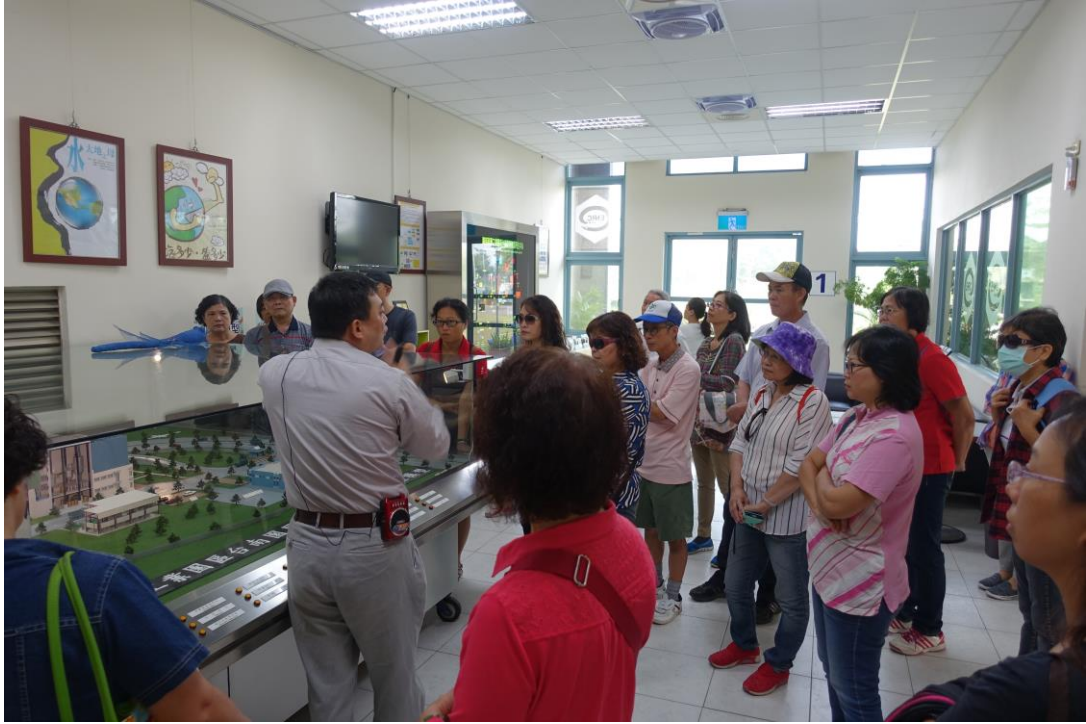
管理局解說員帶著家長說明南科管理局的垃圾及水資源回收情形