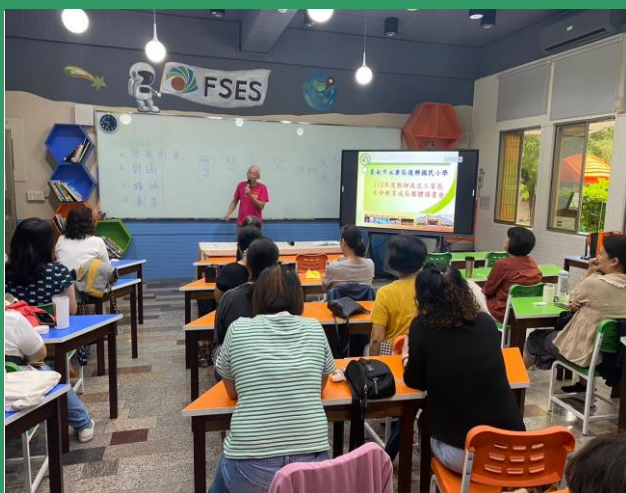
照片說明：講師引導分享及討論影片