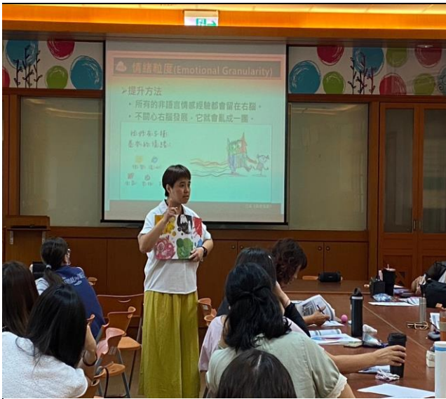
講師介紹參考書籍，並與學員討論互動。