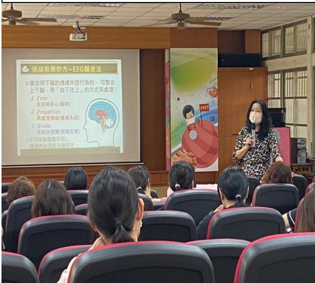
設定明確的規範，並堅定溫和的徹底執行，孩子也比較能夠接受。