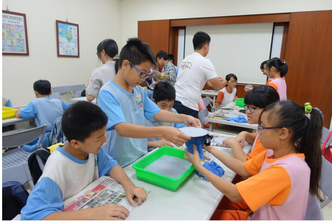
學生DIY再生紙製作，垃圾減量節約能源