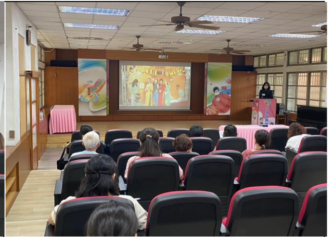
「臺南市家庭教育中心形象片」播放