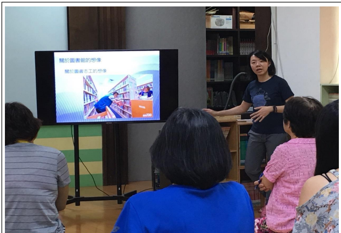
校內圖書館館長說明圖書歸類注意事項