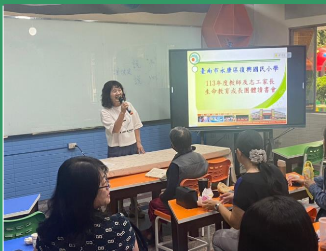
照片說明：志工團團長總結活動。