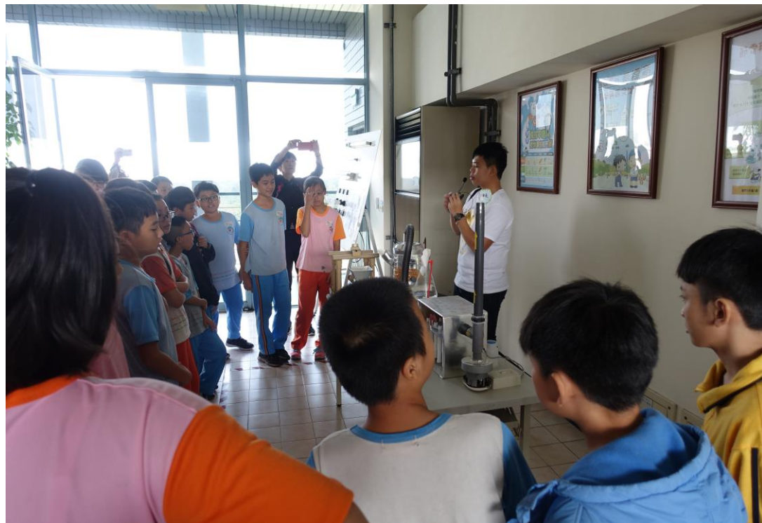
講師帶著孩子說明南科管理局的垃圾及水資源回收情形