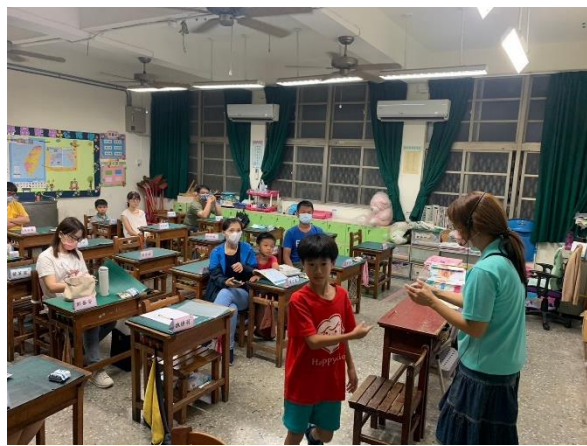
說明：中年級班級宣傳志工招募