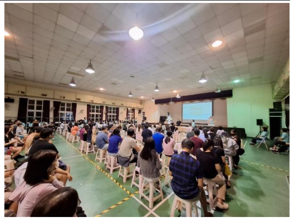
說明：眾多家長會出席班親會-- 是最好的志工招募宣傳時機