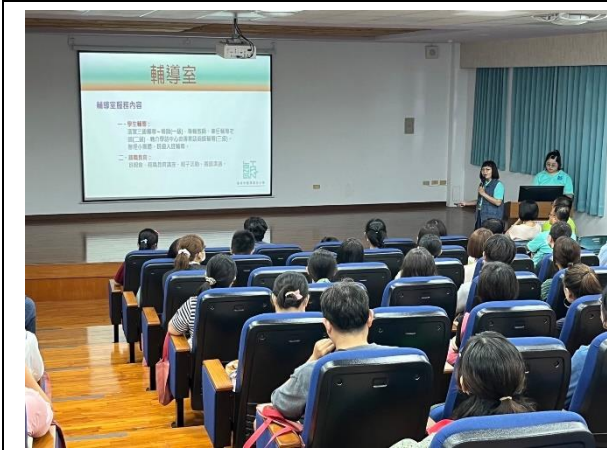
說明：視聽教室志工招募