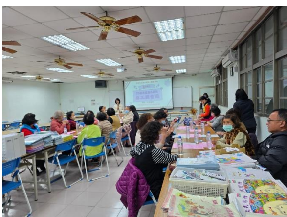
說明：校長親自招募志工