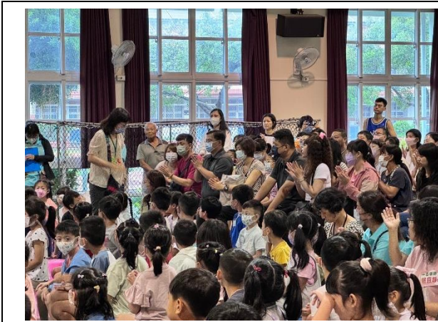
說明：活動中心志工招募-1