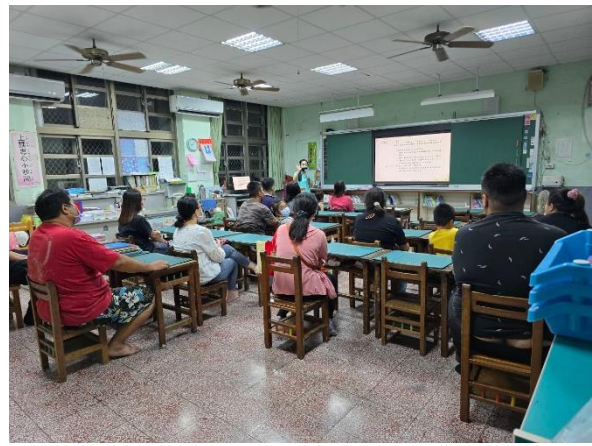
說明：低年級班級宣傳志工招募