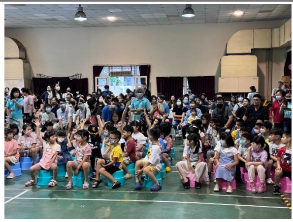
說明：活動中心志工招募-1