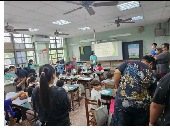
說明：新生班級志工團團長親自招募志工