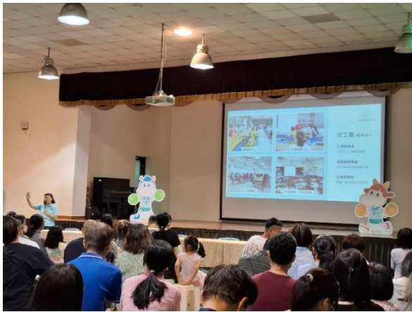
說明：輔導主任介紹學校志工團