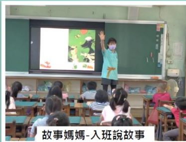
故事媽媽-入班說故事