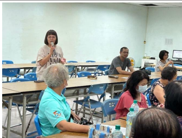
說明：輔導主任親自招募志工