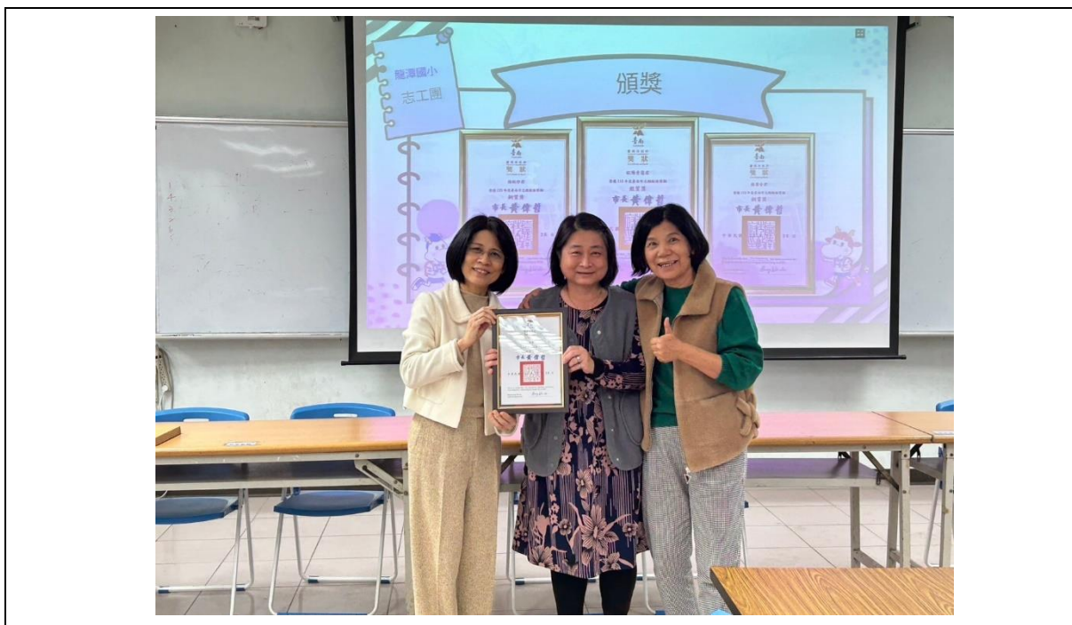
說明：校長、志工團長親自分頒獎發【113 年度臺南市志願服務獎勵-銀質獎】