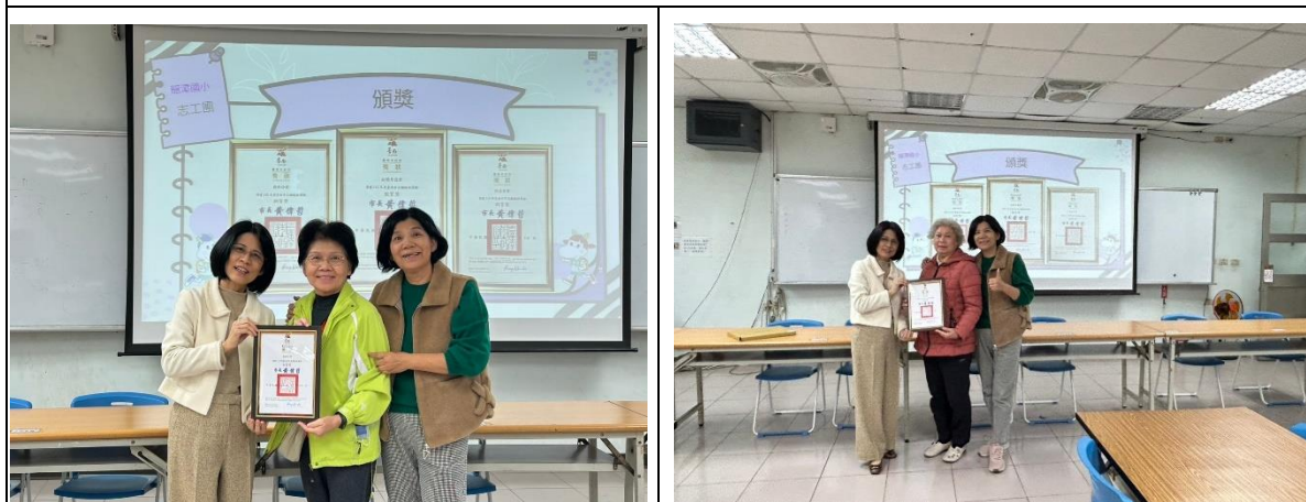
說明：校長、志工團長親自分頒獎發【113 年度臺南市志願服務獎勵-銅質獎】