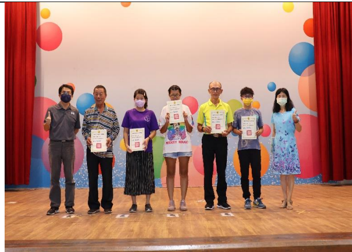
於家長會公開表揚高齡志工