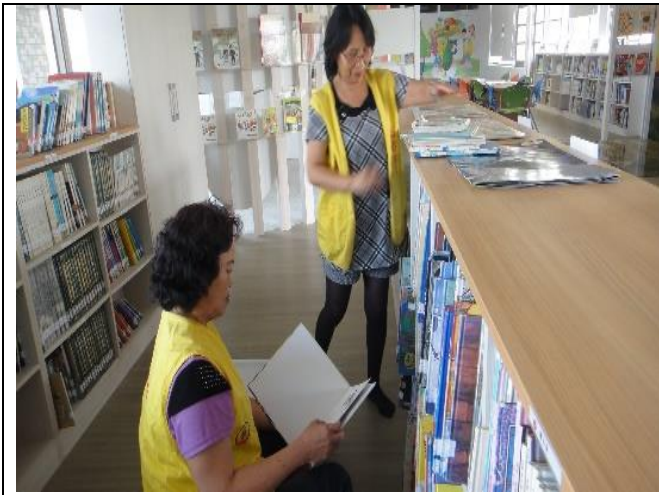
双燕志工64歲，每週二中午固定來學校擔任圖書整理志工