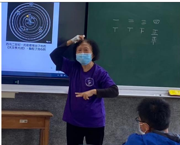
秀卿志工73歲，通過天文志工培訓，擔任晨光天文志工