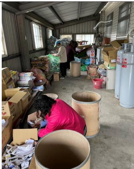
天福志工70歲，每天早上來校進行環保回收的服務