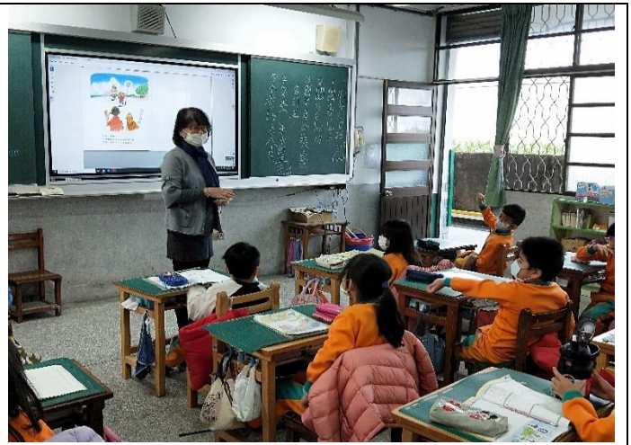
秋桂志工60歲，每週二早上擔任低年級故事媽媽志工