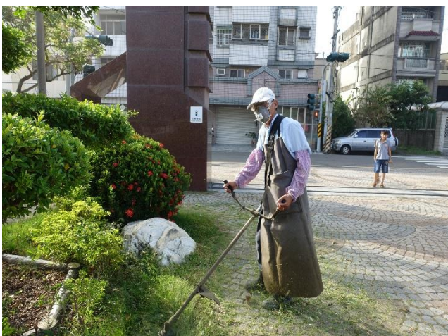
耀如志工73歲，每個月固定於假日進行校園綠美化服務