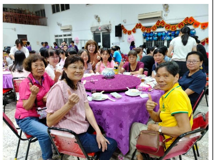
校長於家長會公開表揚高齡志工，肯定他們的付出，並請志工們一起參與餐會