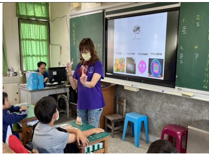
秀櫻隊長今年64歲，仍承擔隊長工作，並擔任晨光天文志工