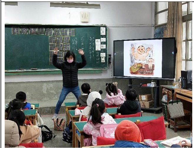
志工隊副隊長惠玲57歲，說起故事來仍活力十足