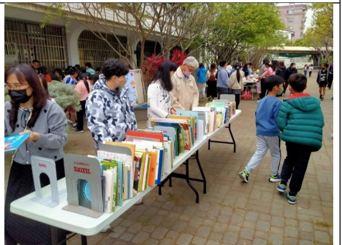
清田志工73歲，是今年新加入的志工，擔任圖書志工，於校慶協助二手書義賣