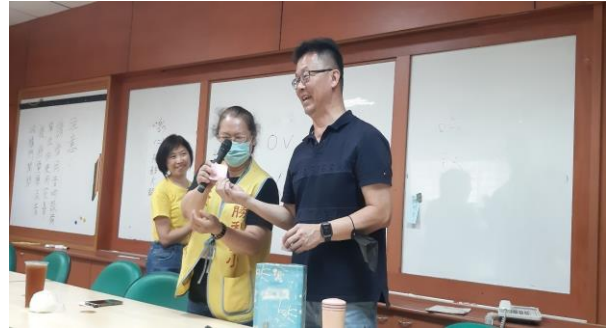
投票下屆團長及幹部