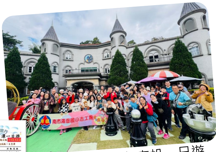
志工團文康活動-南投一日遊

各組聯誼活動、全團性文康活動、免費參與組內或全團培訓課程、本校圖書室借閱權、邀請參與本校研習講座、參與跳蚤市場擺攤等。