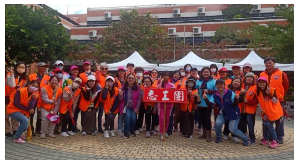
不分組共同協助運動會活動