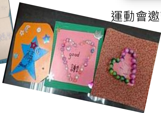
學生製作小卡片，表達對志工的感謝