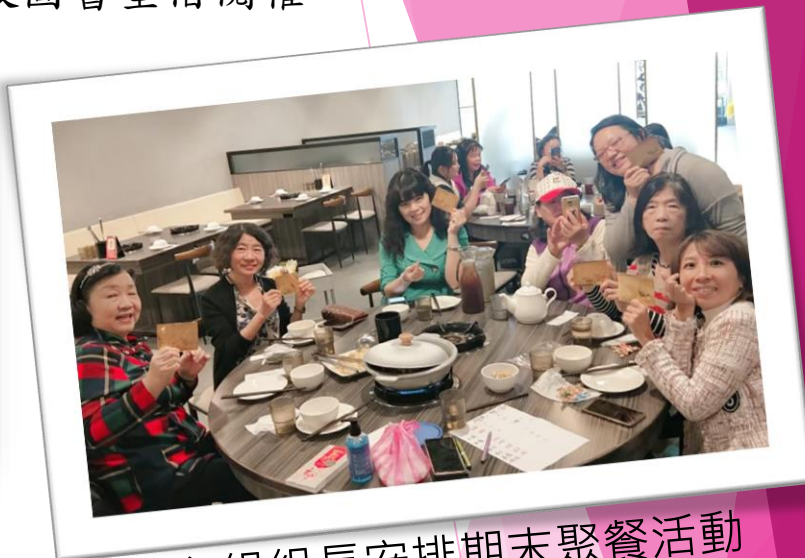
各組組長安排期末聚餐活動