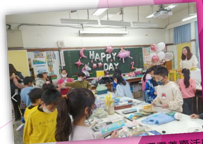
志工參與學校跳蚤市場擺攤義賣活動