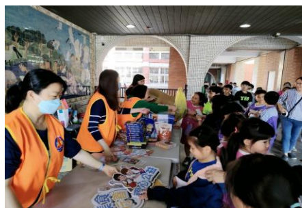
不分組協助安德烈食物銀行

本校志工共146人，其中有22位是跨多組服務，占比約15%。跨多組服務的志工，能分享各組不同運作方式和氛圍，帶動其他志工也參與跨組，投入更多元服務。