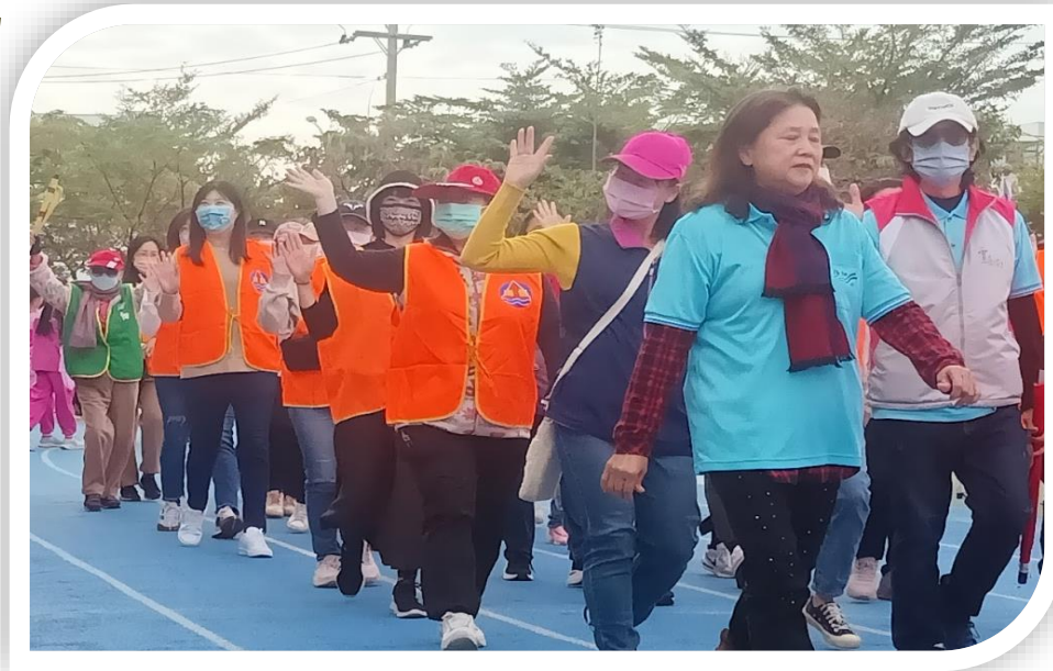
運動會邀請志工團進場，接受全校師生及家長的鼓掌