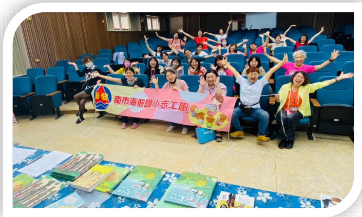
補助各組專業培訓課程經費