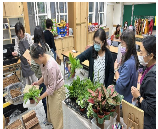
說明：上板植栽課程-選定喜愛植物