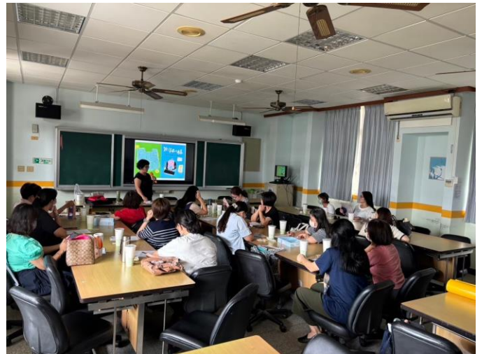
說明：講師分享外婆不一樣繪本內容