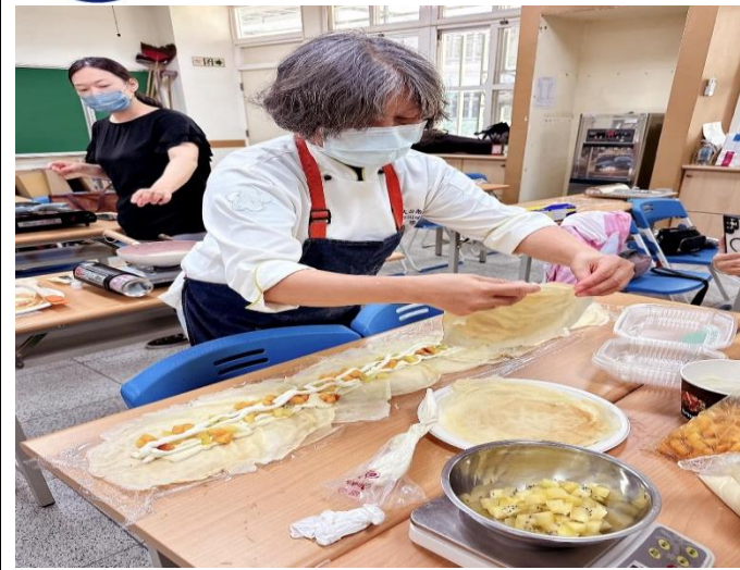
說明：母親節蛋糕捲課程製作課程-講師教學