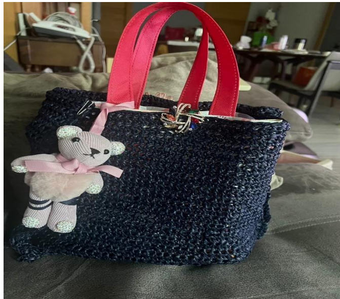
說明：拉菲草手作包課程