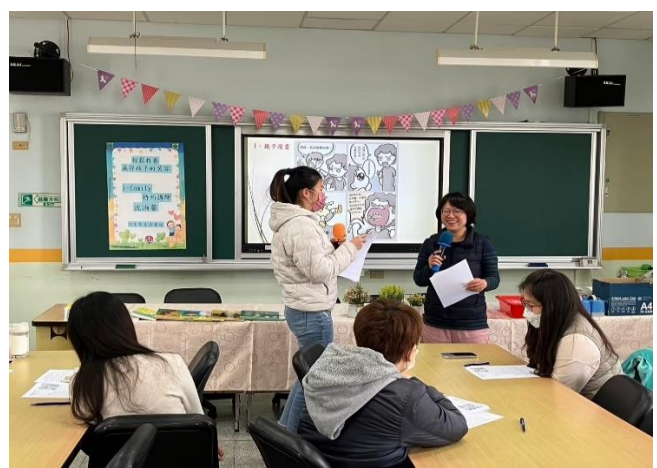
說明:「輕鬆教養-贏得孩子的笑容」教育講座