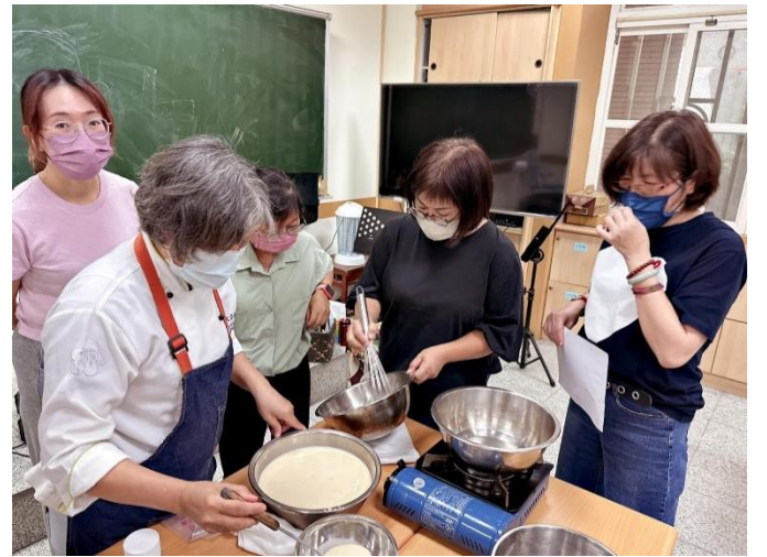
說明：母親節蛋糕捲課程製作課程-學員學習