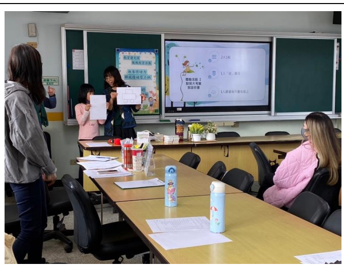
說明：「教養情緒力—釋放壓力情緒鍋」講座