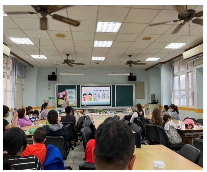
說明：「讓愛起飛-親子溝通學習」教育講座