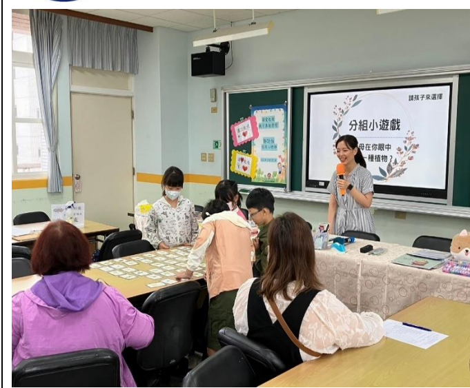
說明：「讓愛起飛-親子溝通學習」教育講座