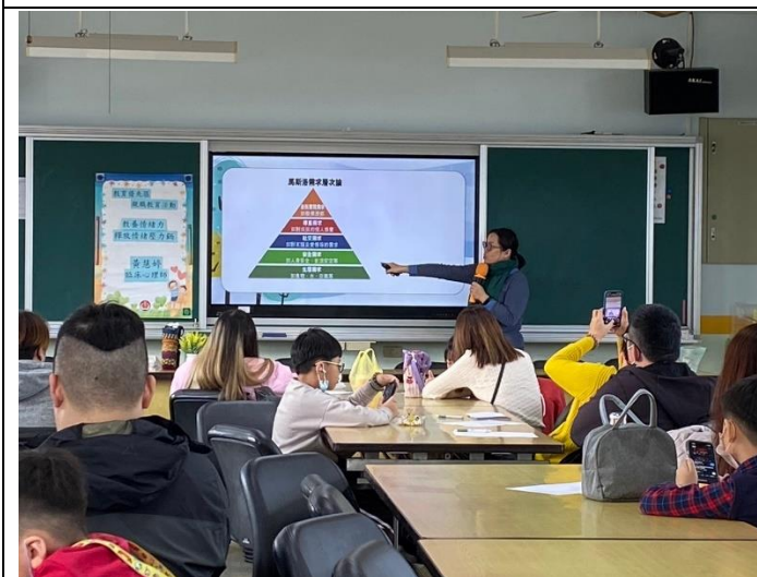
說明：「教養情緒力—釋放壓力情緒鍋」講座