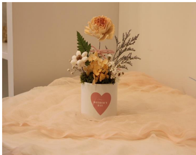
說明：擴香花盆製作課程