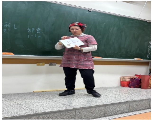
說明：對台灣人而言日語是一種容易學習的語言