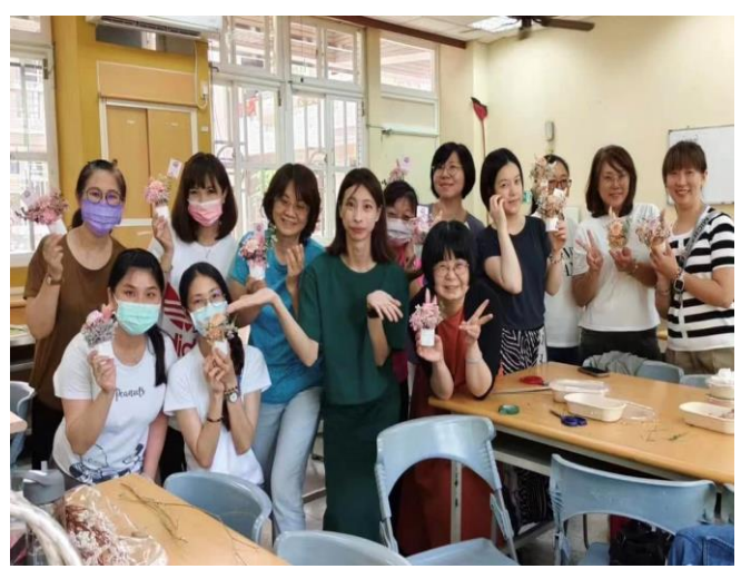
說明：擴香花盆製作大合照