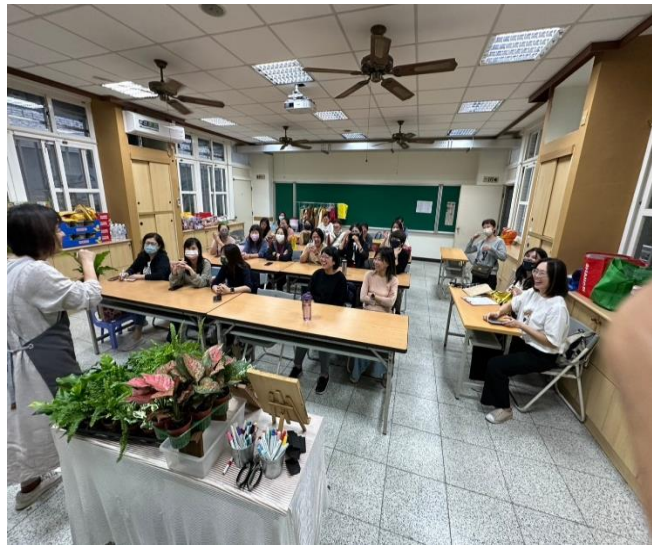
說明：講師說明製作方式