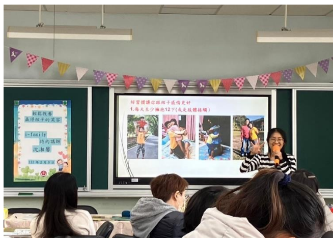
說明:「輕鬆教養-贏得孩子的笑容」教育講座