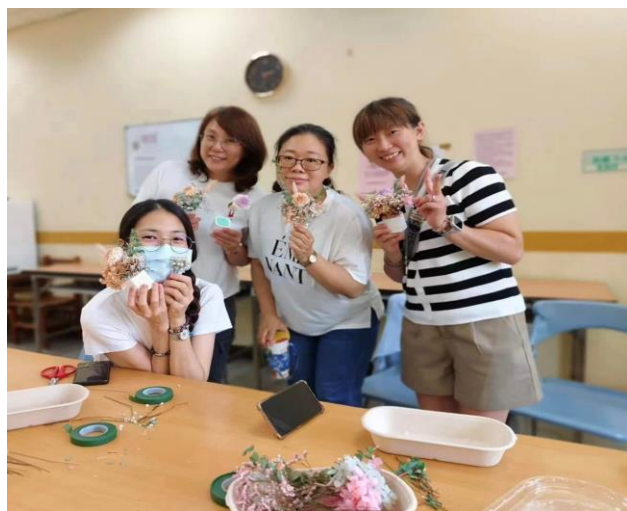
說明：擴香花盆製作展示