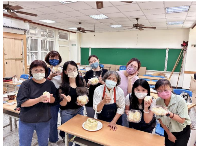
說明：母親節蛋糕捲課程製作課程-享受成果