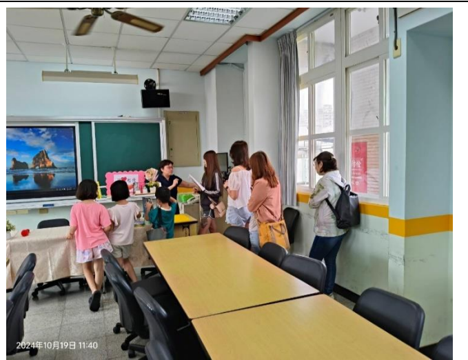
說明：「情緒教養從家庭開始：馴龍高手～擁抱情緒不暴衝」教育講座講座