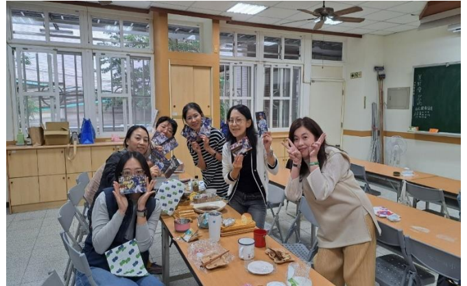
說明: 《享受吧！一個人的旅行》+紙箱烤雞