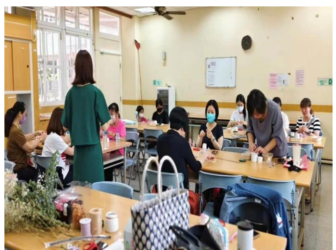
說明：擴香花盆製作課程認真學習