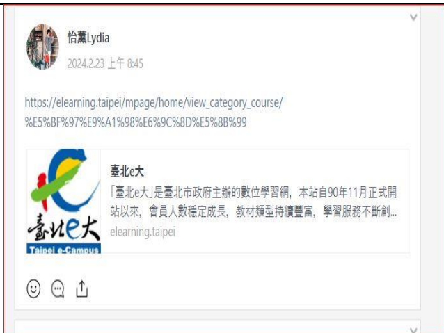
說明: 轉知新進志工志工基礎訓練訊息