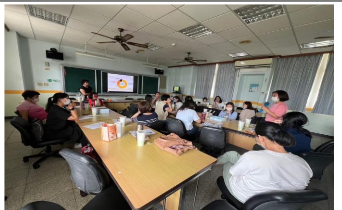
說明：學員分享己身經驗