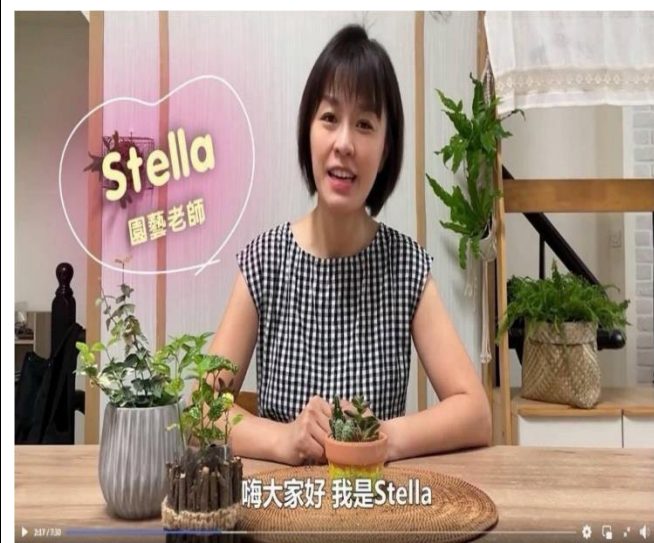
說明：上板植栽課程美麗講師