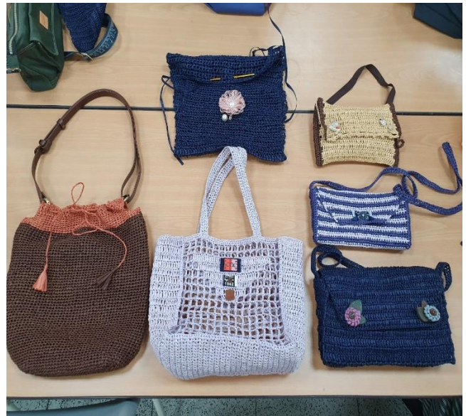
說明：拉菲草手作包課程