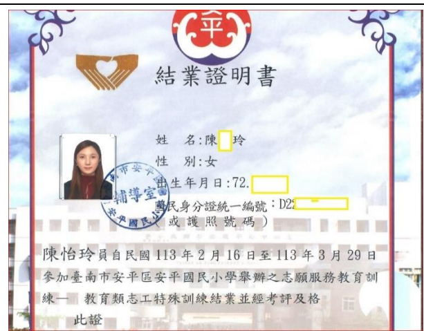
說明: 協助志工取得特殊訓練(部分截圖)