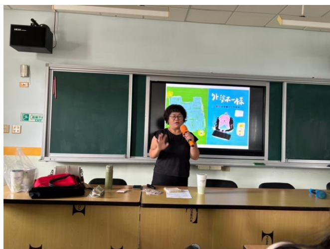
說明：講師分享外婆不一樣繪本內容