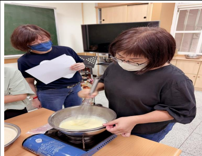
說明：母親節蛋糕捲課程製作課程-動手操作