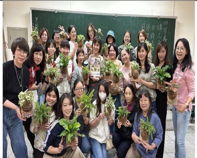
說明：與作品大合照