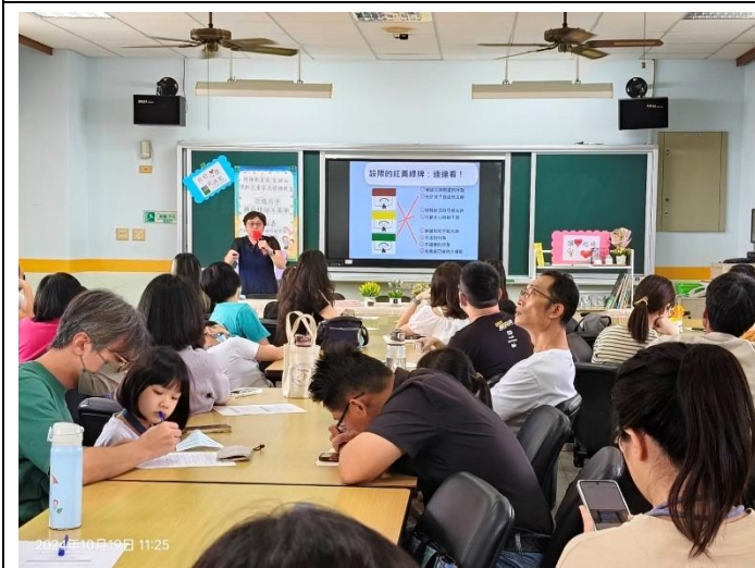
說明：「情緒教養從家庭開始：馴龍高手～擁抱情緒不暴衝」教育講座