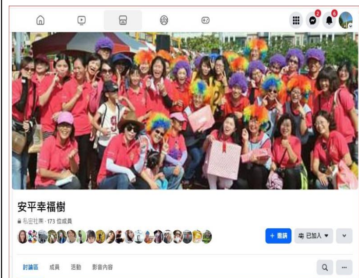
說明：成長性臉書社團-安平幸福樹