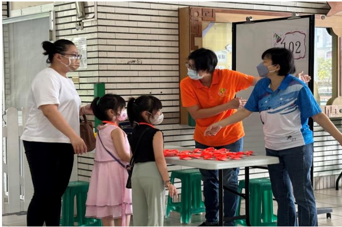
說明:迎新啟蒙招募新志工