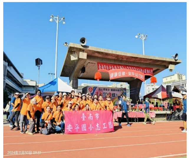
說明:校慶運動會公開頒獎及設立志工攤位