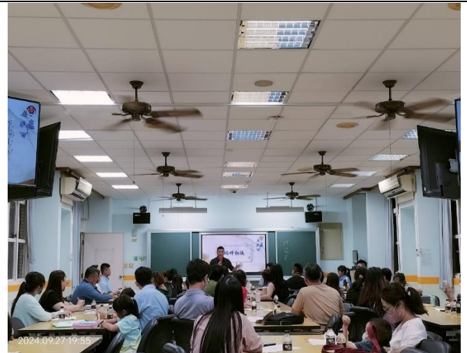
說明:家長大會時招募及宣導志工團。