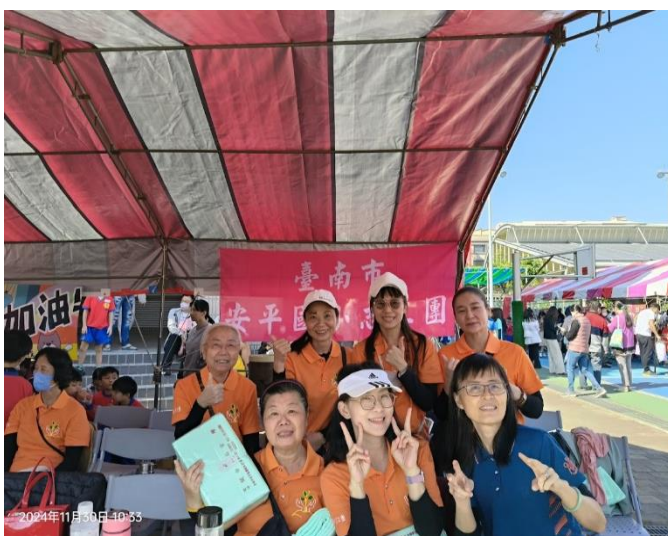
說明:校慶公開頒獎及設立志工攤位