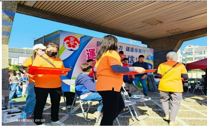
說明:支援校慶頒獎活動，宣導志工團