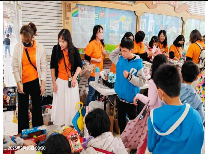
說明：跳蚤市場設立志工攤位