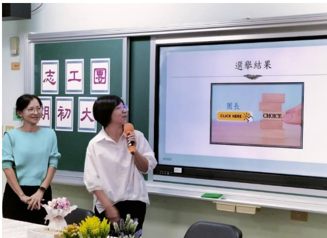
說明:期初、期末大會宣達計畫與成果