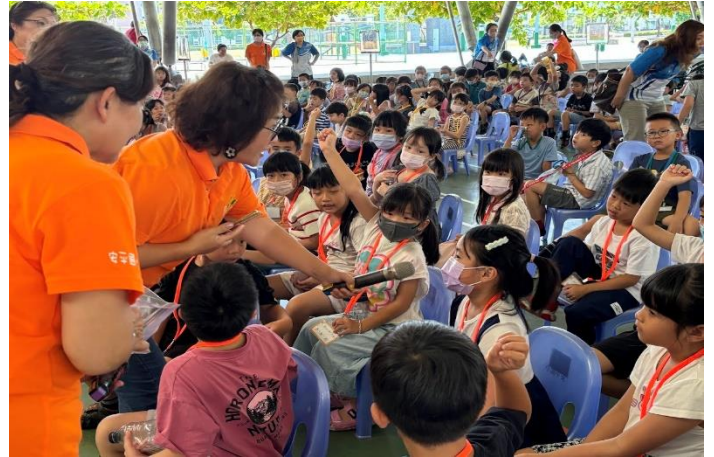
說明:迎新啟蒙協助活動宣傳志工團