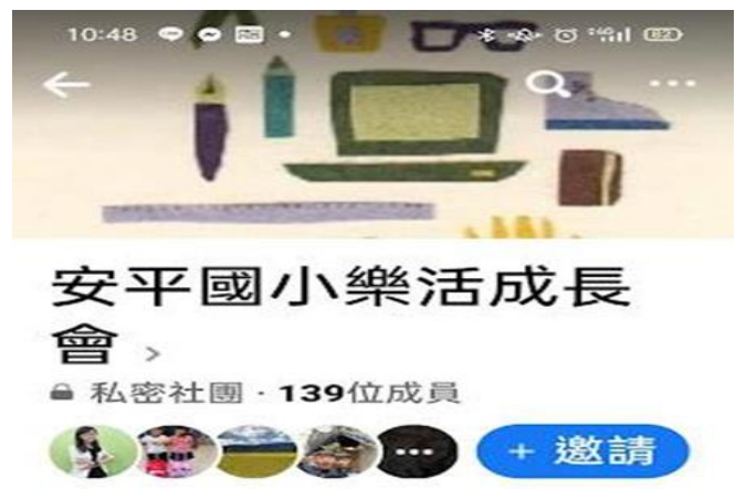
說明：臉書社團-安平國小樂活成長會