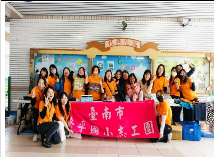
說明：跳蚤市場設立志工攤位