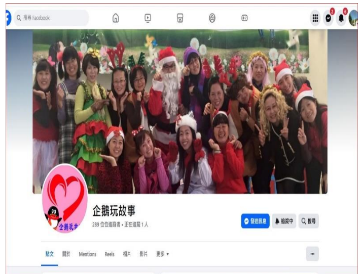
說明：成長性臉書社團-企鵝玩故事