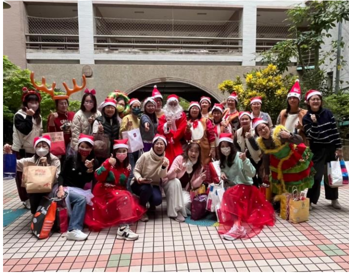
說明:聖誕快閃活動，宣導志工團