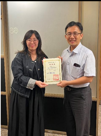
照片說明：績優志工表揚 4