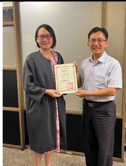
照片說明：績優志工表揚 5