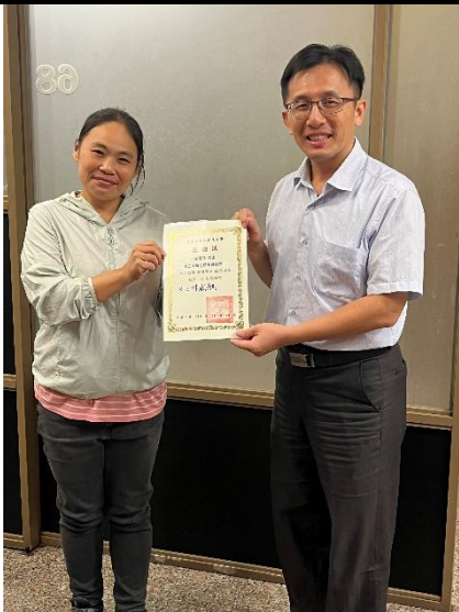
照片說明：績優志工表揚 6