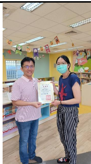
照片說明：績優志工表揚(補頒)11