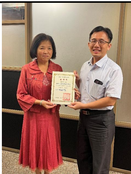
照片說明：績優志工表揚 2