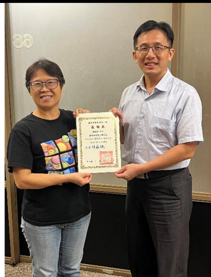
照片說明：績優志工表揚 9