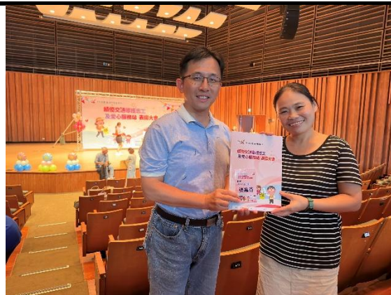
照片說明：臺南市績優導護志工表揚 2