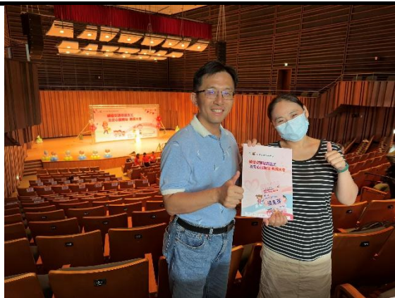
照片說明：臺南市績優導護志工表揚 1