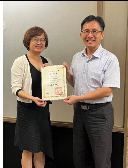
照片說明：績優志工表揚 7