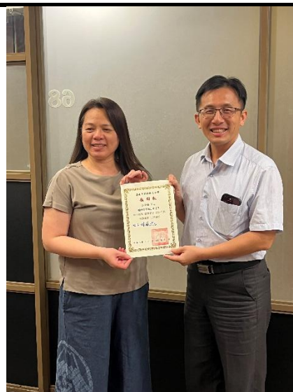
照片說明：績優志工表揚 3