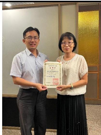
照片說明：績優志工表揚 1