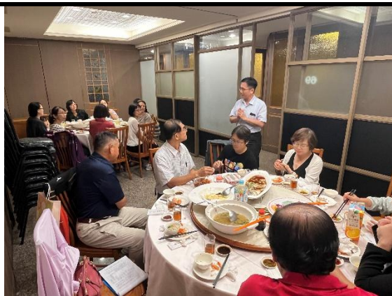
照片說明：志工團會聚餐