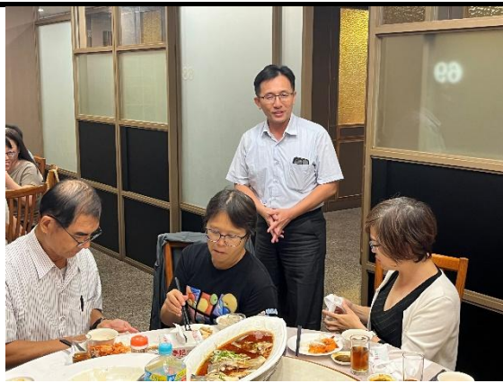
照片說明：校長致詞