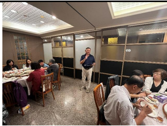
照片說明：志工團務報告