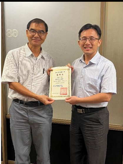
照片說明：績優志工表揚 8